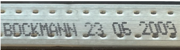
Bilde 1: Bildet av denne avstandslisten viser at vinduet/isolerglasset er produsert 23.6.2009.

Det har blitt benyttet ulike stoffer i fugelime i ulike tidsperioder. Produksjonsåret forteller hvilke stoffer fugelimet trolig inneholder og dermed hva slags avfall dette er. Se veilederen på side 3. Produksjonsåret står som oftest trykket inn i avstandslisten mellom glassene (se bilde 1 nedenfor).